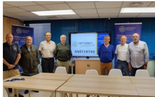
Reunión Club Senior