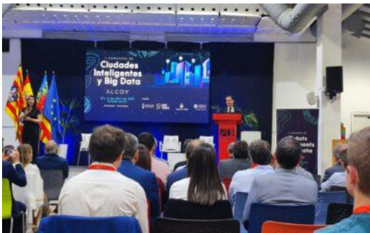
Congreso Big Data Alcoy