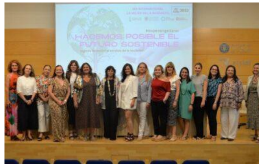
Jornada "Futuro Sostenible"