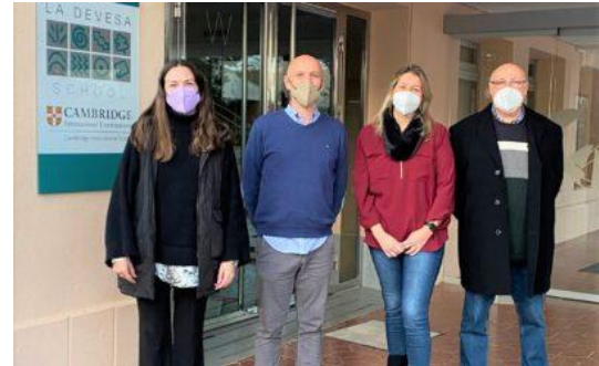
Convenio con GSE