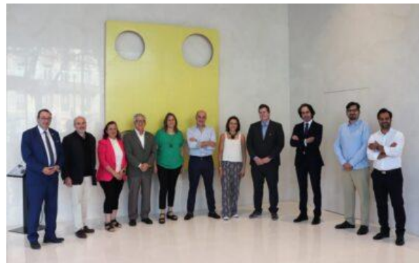
Acuerdo Marco Colaboración