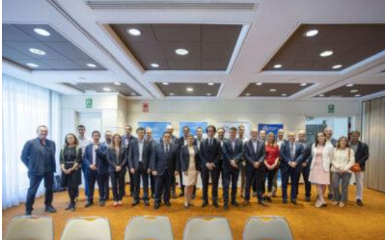
Jornada Día de las Telecomunicaciones