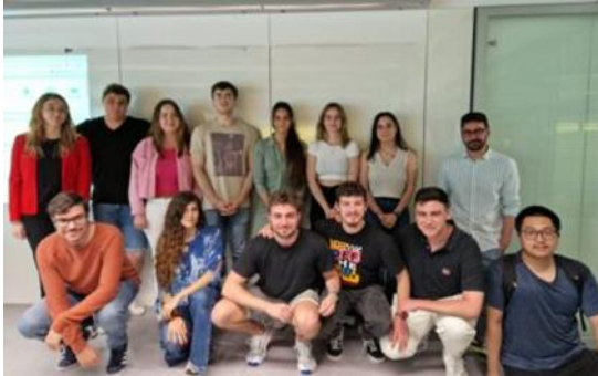
Foro Empleo ETSE-UV