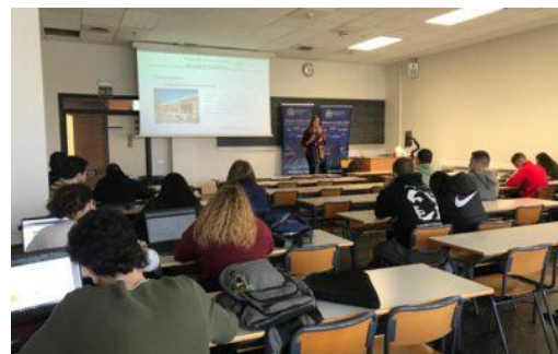
Visita al Campus Gandia-UPV