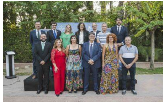
Toma posesión nueva junta COGITCV