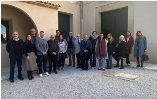
Smart Digital "Turismo 4.0"