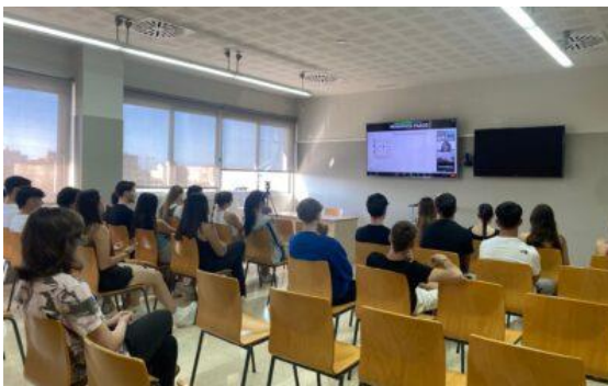
Charla motivacional GSE