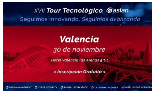
Tour Tecnológico ASLAN