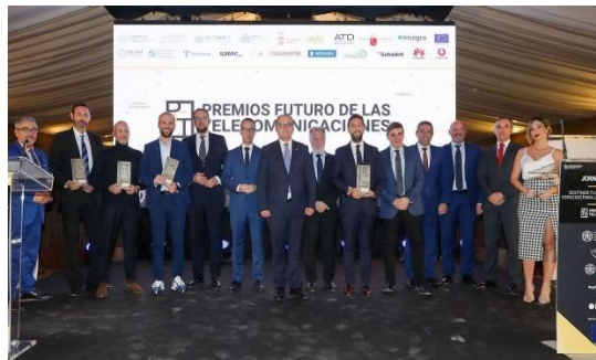
Foro Telecom Murcia