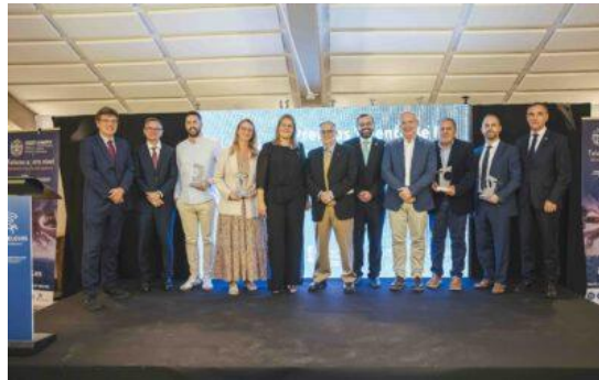
Celebramos Foro Telecos CV 2023