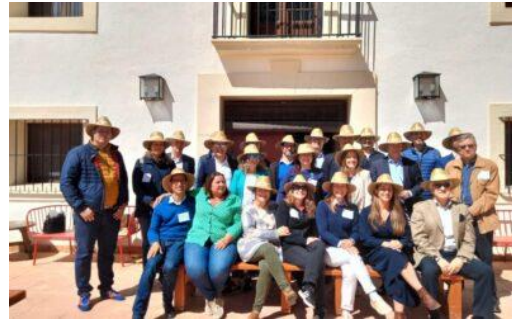
Reunión trabajo Smart Digital