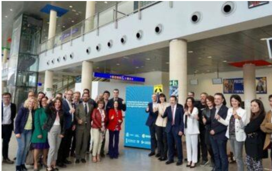
Presentación centros incubación ESA-BIC