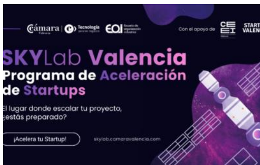
Colaboración en SkyLab de Cámara Valencia