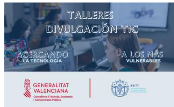
Talleres divulgación tecnológica