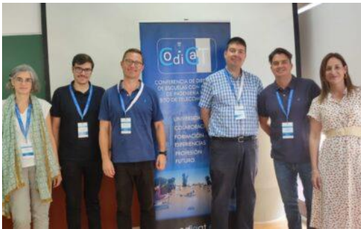
Reunión CODIGAT 2023