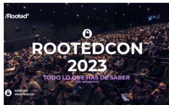
Colegiados en RootedCON VLC23