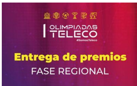
Premios regionales | Olimpiada Teleco