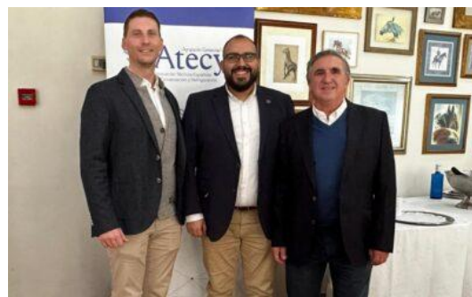
Comida navidad ATECYR