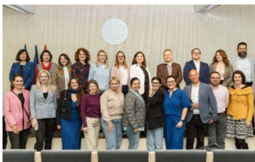
Liderazgo Femenino en Tecnología