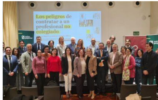
Jornada Unión Profesional de Valencia