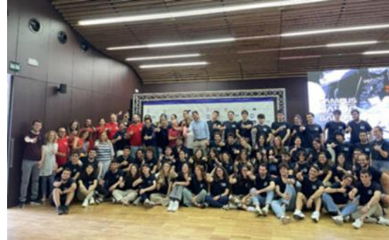
Hackaton Campus Salud Gandia