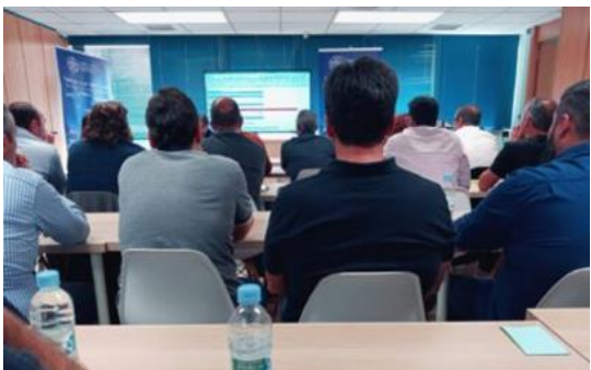
Asamblea General COGITCV/AGITCV 2023