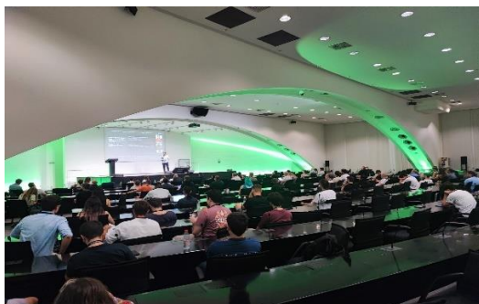
NFT Show Europe