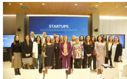
“StartUps que impulsan la sociedad”