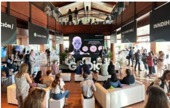
Go Digital: Human First