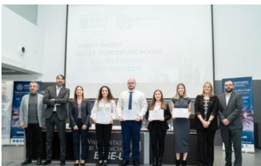
III Edició Premis Enginy de les Telecomunicacions