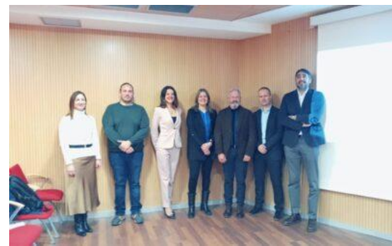
Jornada Smart Digital Ciberseguridad