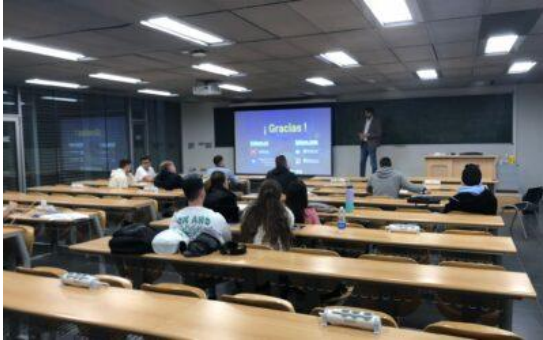
Charla alumnado EPSE-UMH