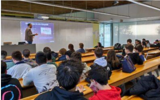
Charla alumnado ETSE-UV