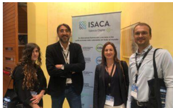
XV Congreso ISACA Valencia 203