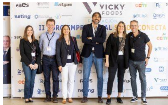
Foro Empleo Campus Gandia-UPV