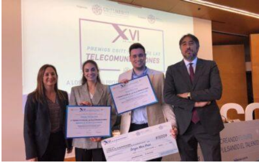
Premios COITT Futuro de las Telecomunicaciones