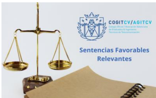
Sentencia favorable RITE