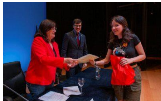
Olimpiada del Saber UV