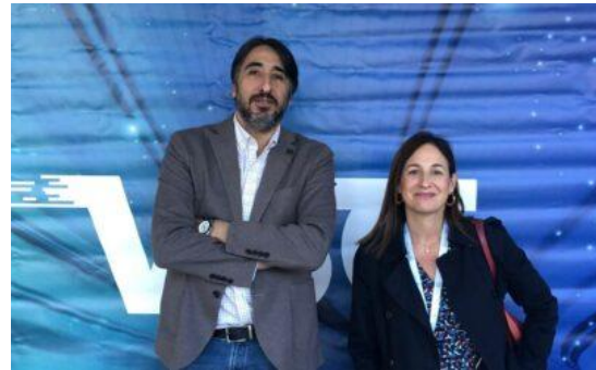
Congreso Valencia 5G Days