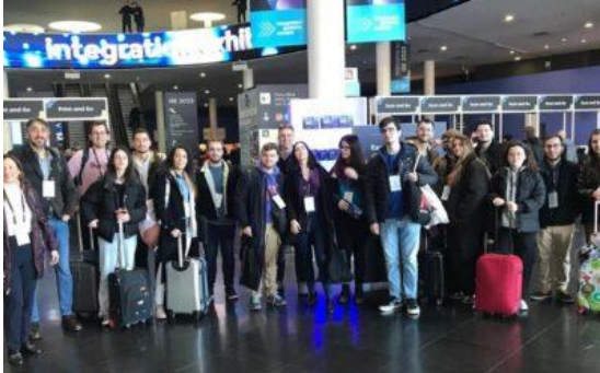
Alumnos CV en ISE 2023