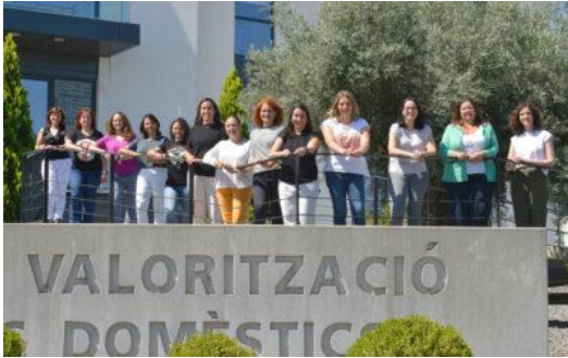
Reunión ingenieras referentes