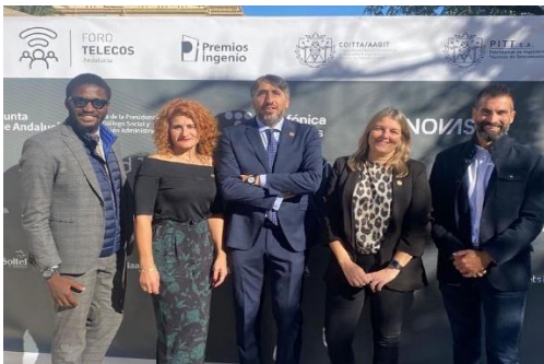
Foro Telecom Andaluca