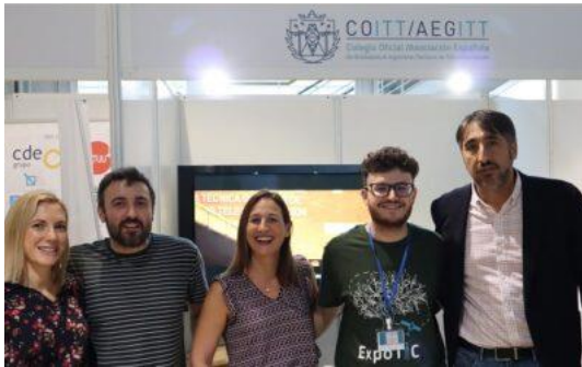
Congreso CEET 2023