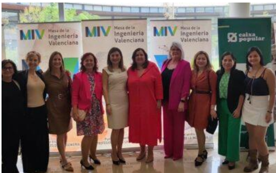
Womanation Congress 2023