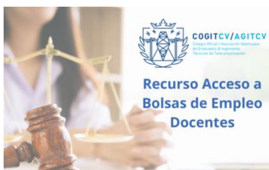
Recurso Bolsa Empleo Secundaria