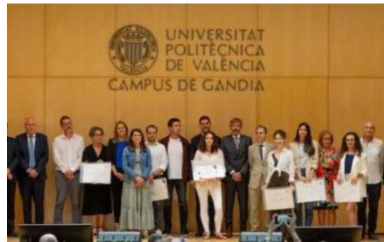
Inauguración curso Campus Gandia-UPV