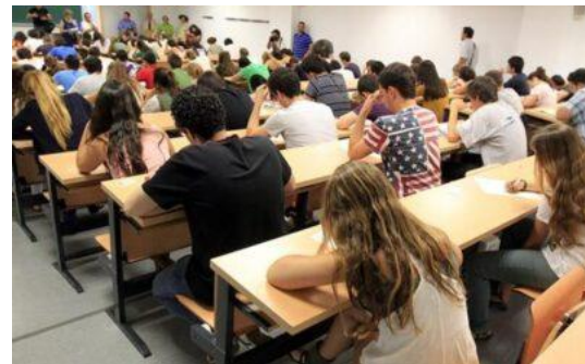
Elevan a 0,2 la ponderación