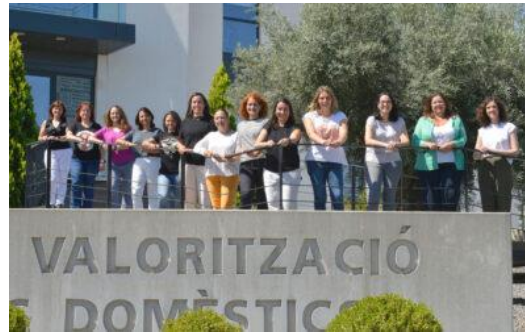
Vídeo Mujeres Ingenieras