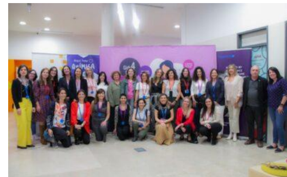
Charla profesional Girls4STEM