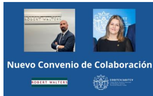
Convenio con Robert Walters